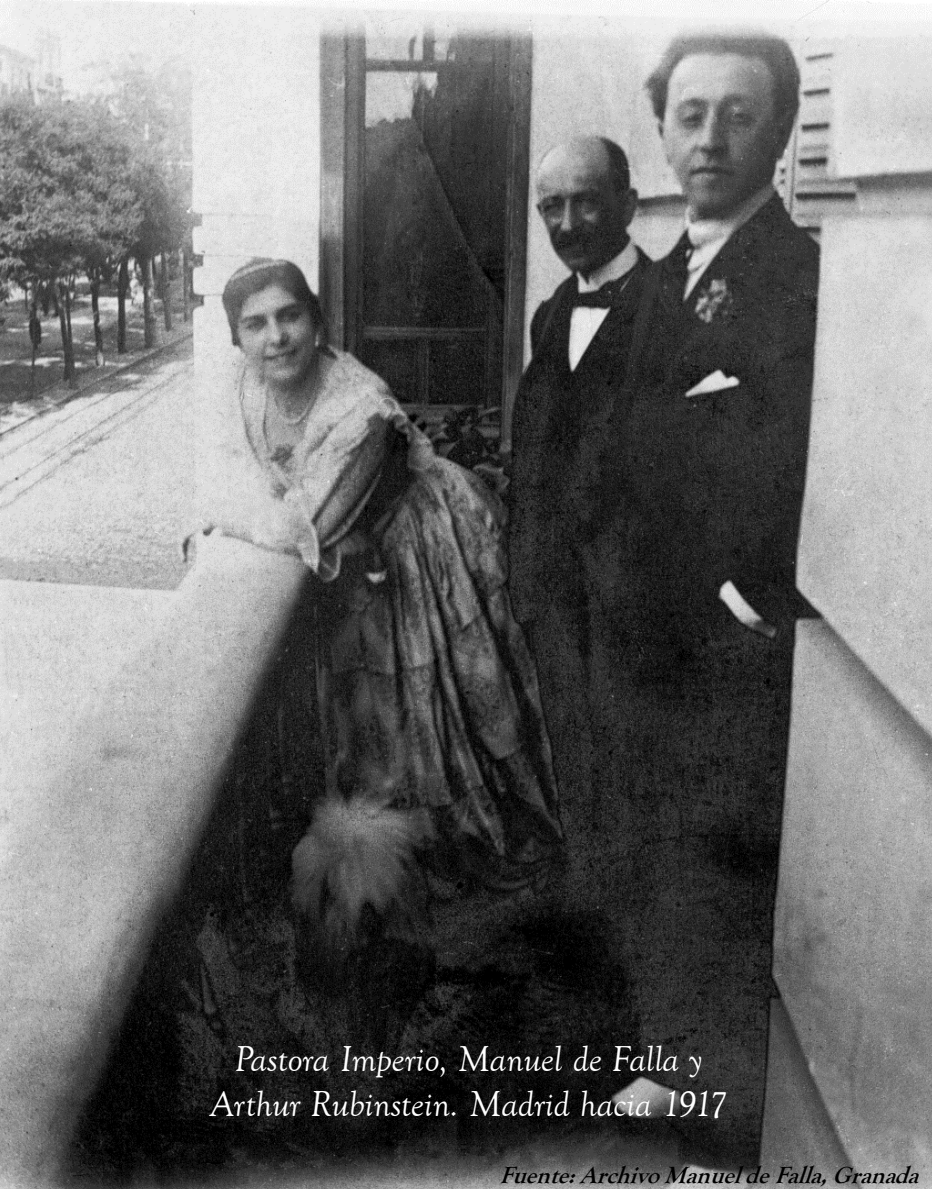
Pastora Imperio, Manuel de Falla y Arthur Rubinstein. Madrid hacia 1917