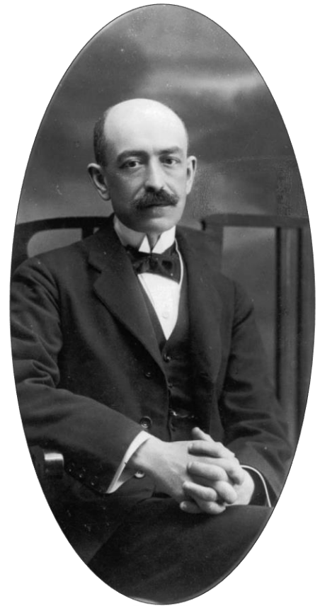
Manuel de Falla, 1915