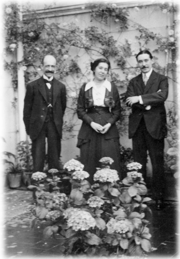
Manuel de Falla, María Lejárraga y Joaquín Turina Madrid 1916